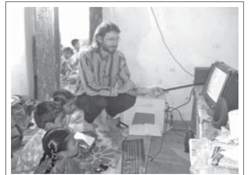
కంప్యూటర్ శిక్షణ ఇస్తున్న బ్రదర్ బోనీగారు

తమ జీవితాలలో తెలివైన నిర్ణయాలు తీసికొనుటకు తప్పొప్పుల మధ్యగల వ్యత్యాసమును